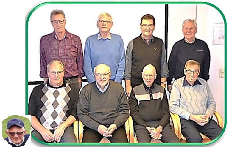
Veterankommittén januari 2020